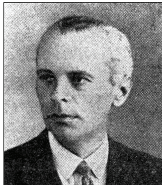
Őrgróf Pallavicini György (1930-as évek eleje)

Hitvese, hátrahagyott feljegyzésében ekképp jellemezte férjét: „A század első évtizedeiben dúló ádáz pártpolitikai harcok töltötték be életét. Középen állva, jobbra és balra is hadakozott a zsarnokság ellen, a királyság mellett, a fasizmus ellen, a magyar szuverenitás mellett, örökös ellenzékben. Cikkék, párbajok, nyílt levelek, beszédek, memorandumok, mandátumok és választási bukások fürgetegében, mindig vehemens állásfoglalással, férfias kiállással egyenes és kellemetlen ellenfél volt. Nyugtalan és nyugtalanító. Éleslátású és élesvágású, kritikája ostorcsapás, támadása kardvágás. Hála Istennek, nem élte meg világának teljes összeomlását...” 2